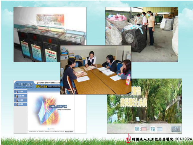
財團法人天主教若瑟醫院 101/10/24