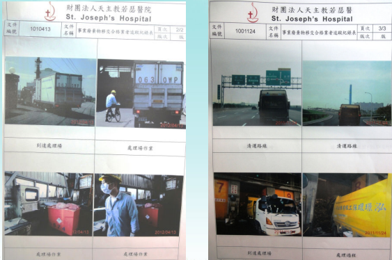
一般事業廢棄物移交合格廠商追蹤照片