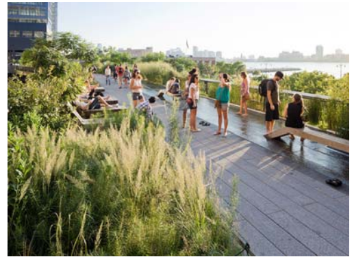
美國紐約高架公園，綠化廢棄鐵道，成為城市綠色新景觀

他除了是當時著名的公園設計師之外，也是活躍的環境保護人士，他曾參與保護美國的尼加拉瓜瀑布免於因為興建工業用發電廠而遭受破壞，保護自然景觀不遺餘力。