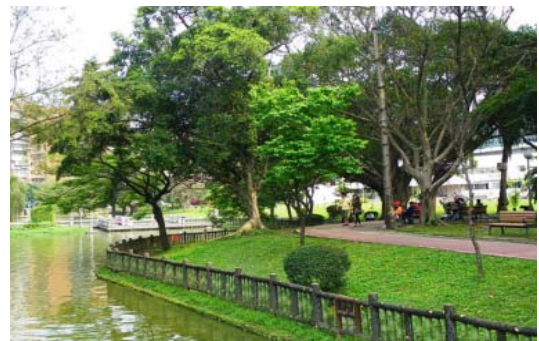
青年公園源自於當時的台北南機場，是景觀重新規劃，開放於民的案例