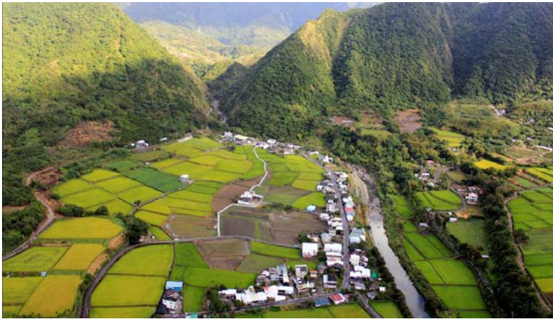
花蓮縣富里鄉吉哈拉艾部落，人與自然共存的美麗地景